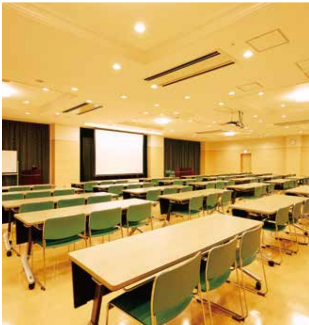
地域の方に低額で貸し出されている「地域交流センター アゼリアホール」。

救急体制、将来への展望、地域との交流、人材育成などさまざまな面で活動を行っている倉吉病院。理事長の考えである「停滞は後退」を体現するかのよう、病院内に溢れる活き活きとした雰囲気印象に残った。