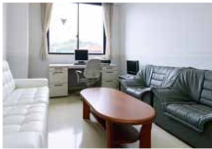
各医師に用意されている個室。執務、休憩、食事などに利用される。