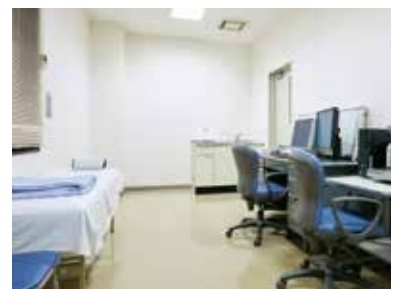
外来の診察室。外来棟は病棟とは別の建物にあり、外来患者の利便性に配慮している。

〒682-0023 鳥取県倉吉市山根43 TEL:0858-26-1011 FAX:0858-26-4794 URL:https://www.med-wel.jp/kurabyou/