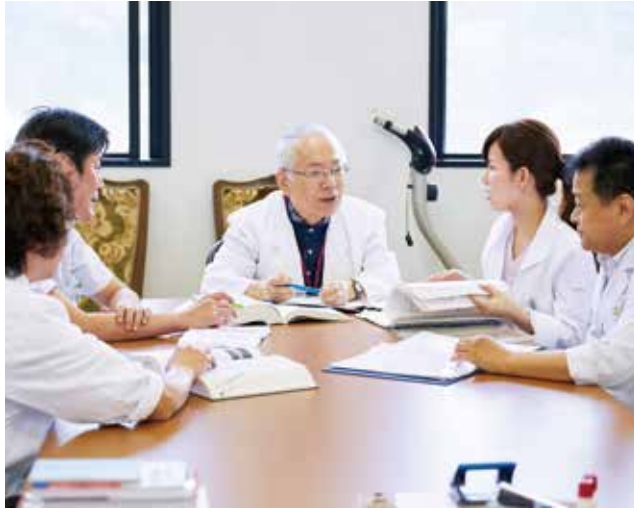
カンファレンスの様子。医師だけでなく薬剤師なども参加することがあるという。

また、日本医療機能評価機構による病院機能評価も受けており、2013年には4度目の更新をして